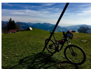
Aussicht vom Hörnli