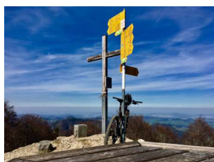
der höchste Punkt des Kanton Zürich