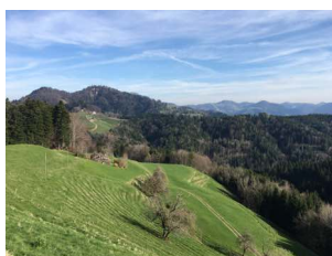
Blick zurück zum Hörnli und Schnebelhorn