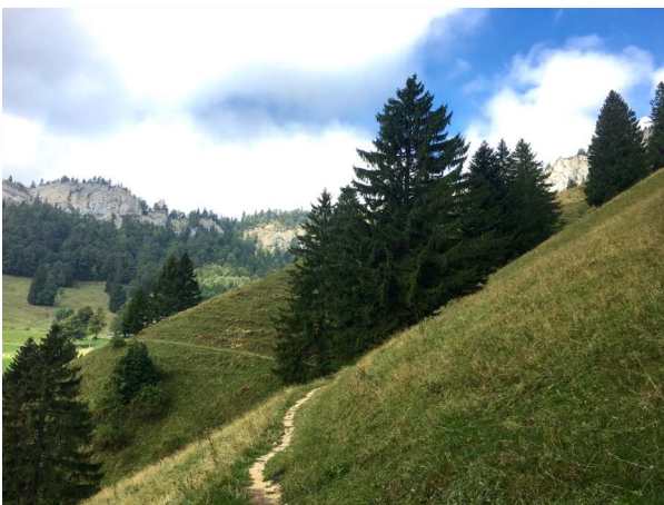
schmaler Weg hinauf zum Unter Brüggli