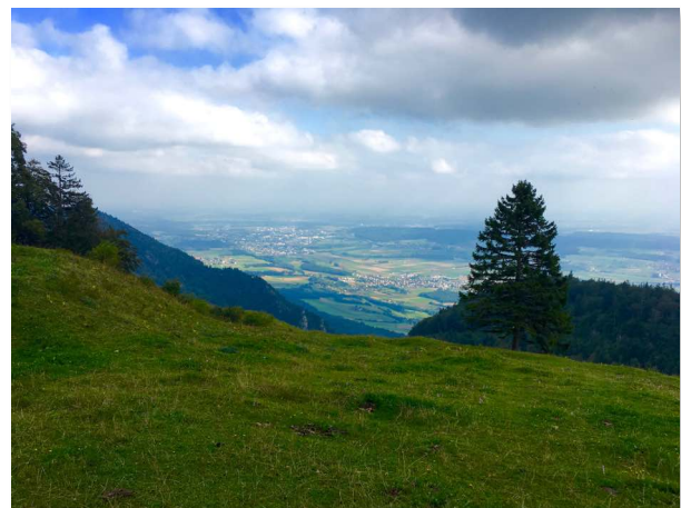
Aussicht ins Mittelland