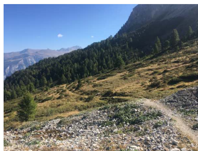
Singletrail nach Promischur