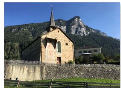
Die Kirche St. Martin in Zillis