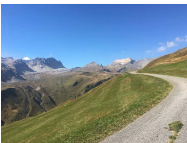
Strasse oberhalb Wergenstein