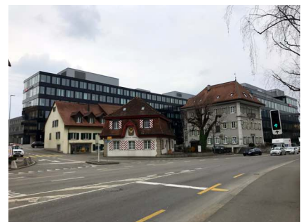
Wenn Alt auf Neu trifft, wird das Alte meist unbarmherzig erdrückt. Das Zollhaus in Olten