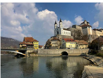
die Woog und Festung bei Aarburg